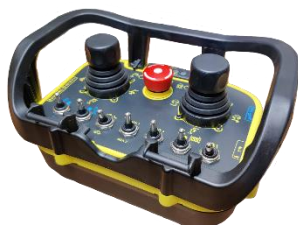
Langaton radio-ohjaus, sähkömalleihin