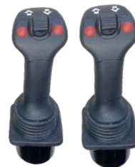
Sähköinen esiohjaus, propo UV