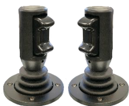
Sähköinen esiohjaus minivipu UV