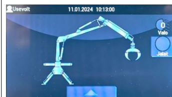
Sähköisen esiohjauksen ohjelmointinäyttö UV