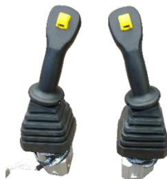
Hydr. esiohjaus, propo