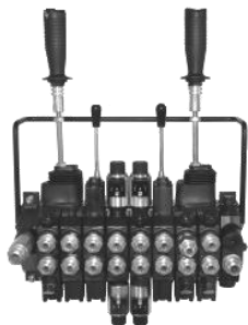
On / Off venttiili